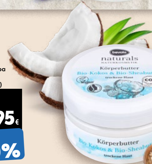
Maslac za tijelo kokos i shea maslac 200 ml (=11 22,95 €)