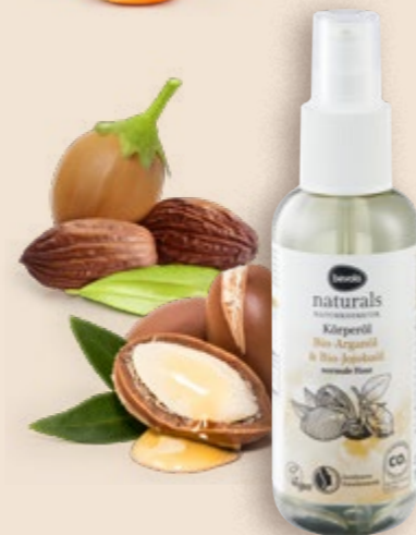
Ulje za tijelo argan i jojoba 150 ml (=11 39,67 €)