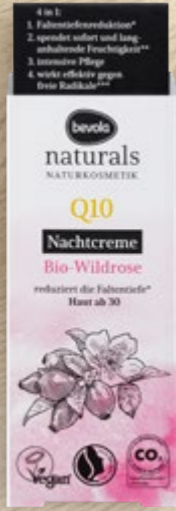
Krema za lice noćna ili dnevna Q10 naturals 50 ml (=11 37,80 €)