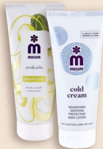
MELEM Losion avokado ili cold cream 200 ml (=11 24,95 €)