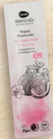
Maska za kosu naturals repair 20 ml