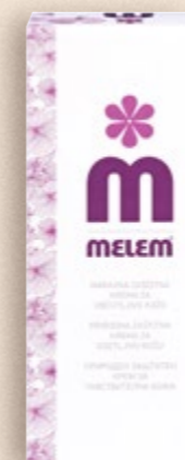
MELEM Krema tuba 50 ml (=11 153,- €)