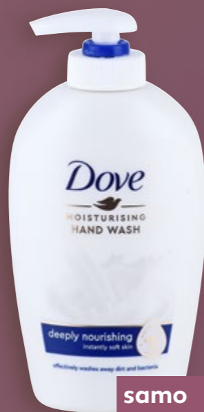
DOVE Tekući sapun Deeply nourishing 250 ml (=11 11,96 €)