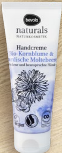
Krema za ruke naturals 75 ml (=11 30,- €)