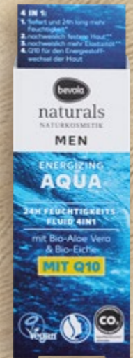
Hidratantna krema Men naturals 50 ml (=11 65,80 €)