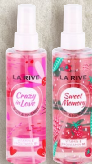
LA RIVE Mirisna vodica za tijelo i kosu crazy in love ili sweet memory 200 ml (=11 24,45 €)