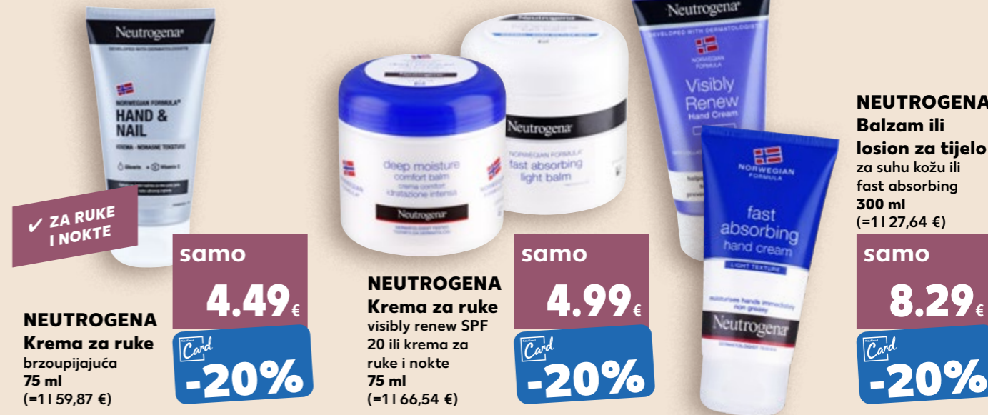
✓ ZA RUKU I NOKTE NEUTROGENA Krema za ruke brzoupijajuća 75 ml (=11 59,87 €)