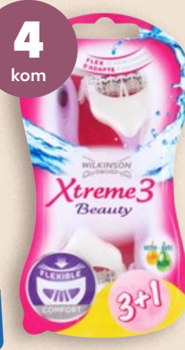
4 kom WILKINSON Britvice Xtreme beauty pakiranje (= kom 1,19 €)