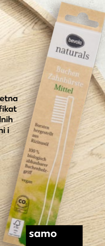
Četkica za zube naturals bukva komad