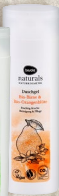
Gel za tuširanje naturals razne vrste 250 ml (=11 7,16 €)