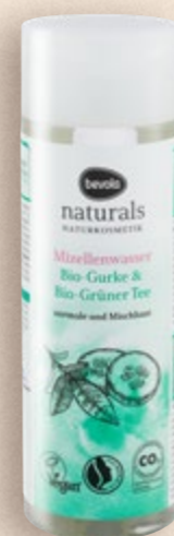
Micelarna voda naturals 200 ml (=11 11,95 €)