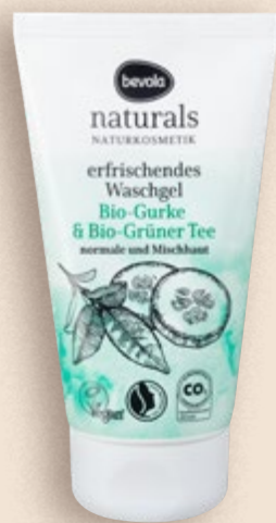
Gel za čišćenje lica naturals 150 ml (=11 21,94 €)