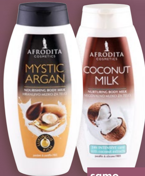
AFRODITA Mlijeko za tijelo razne vrste 250 ml (=11 17,40 €)