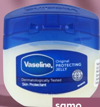
VASELINE Krema original 50 ml (=11 49,80 €)

Vazelin je mješavina mineralnih ulja i voska koji tvore polukrutu tvar nalik želeu. Lako se razmazuje, ima vrlo široku primjenu te je pravi saveznik za njegovanu i nahranjenu kožu.