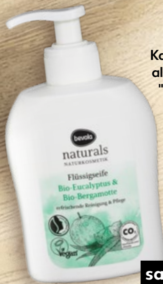
Tekući sapun naturals eukaliptus i bergamot 300 ml (=11 8,84 €)

Kauflandova marka bevola naturals® povoljnija je i jednako kvalitetna alternativa kozmetici za njegu cijeloga tijela. Proizvodi imaju certifikat "NATRUE" koji označava recepture bez silikona, parafina, mineralnih ulja, mikroplastike te umjetnih boja i mirisa. Klimatski su neutralni i dolaze u pakiranjima koja su iz dana u dan sve održivija.