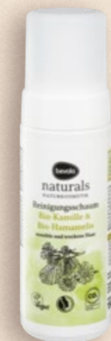
Pjena za čišćenje lica naturals 150 ml (=11 30,60 €)