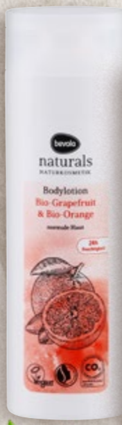
Losion ili mlijeko za tijelo grejp i naranča ili kakao i mango 250 ml (=11 13,16 €)