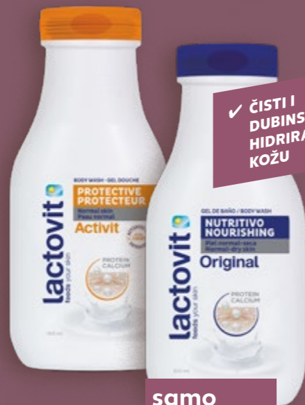
LACTOVIT Gel za tuširanje Original, Activit ili Lactourea 300 ml (=11 7,50 €)