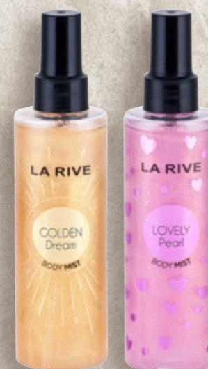
LA RIVE Mirisna vodica za tijelo golden dream ili lovely pearl 200 ml (=11 28,45 €)